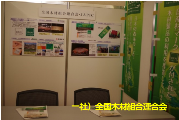
一社) 全国木材組合連合会