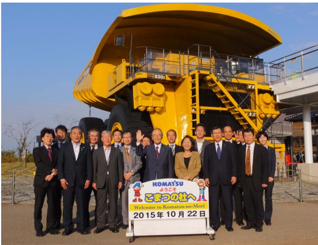
現地視察会（コマツの杜 世界最大級ダンプ「930E」前にて記念撮影）（1号車）