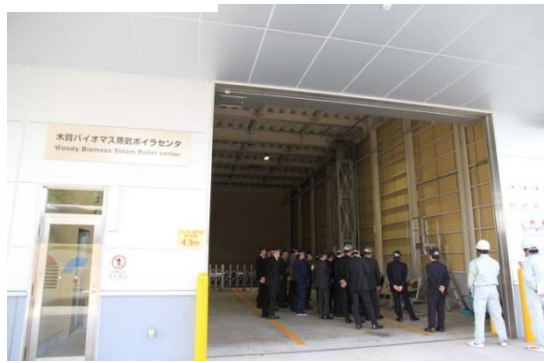
現地視察会（コマツ栗津工場 建設機械などを精算する新工場ライン視察）