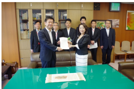
国土交通省足立技監との手交