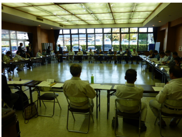
熊本県五木地域森林整備推進協定の メンバーの方々との会合

そして、12月5日に開催された第25回森林再生事業化委員会で、九州視察会での「地域モデル」についての打合せ結果を報告し、森林再生事業化委員会として「次世代林業システム」を進めていくうえで、熊本県五木地域をモデル地域として、五木地域森林整備推進協定の運営及び取組にJAPICも参画し、進めていくことを協議しました。